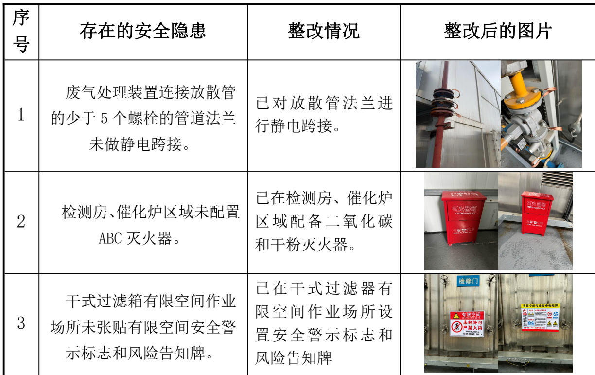
表 6.3-1 事故隐患整改落实情况一览表