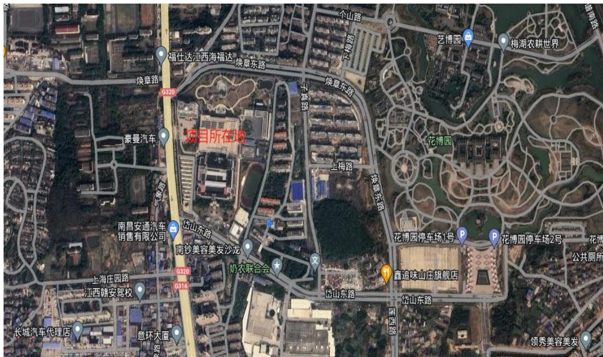
图1 本项目地理位置图